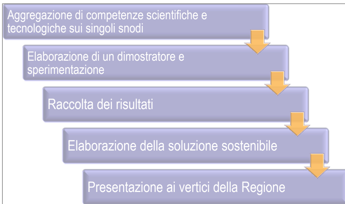
Figura 3 – Fasi della metodologia

Il modello di azione Da un punto di vista operativo, saranno avviate rapidamente e in via sperimentale le attività relative ai due progetti pilota che hanno per oggetto rispettivamente Industria 4.0 in Puglia e la filiera aerospaziale regionale.