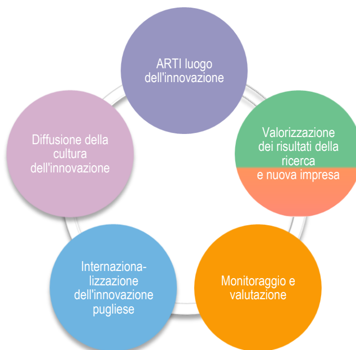
Figura 2 – Le linee di attività dell'ARTI

Le linee di attività che hanno caratterizzato l'Agenzia negli ultimi anni rispondevano a una vision , che era quella di diventare l'Agorà dell'innovazione in Puglia, percepita come tale sia all'interno sia all'esterno del territorio regionale, attraverso un'azione trasversale e pervasiva – come l'innovazione – rispetto alle diverse politiche regionali . Tali linee sono sintetizzate dallo schema di Figura 2.