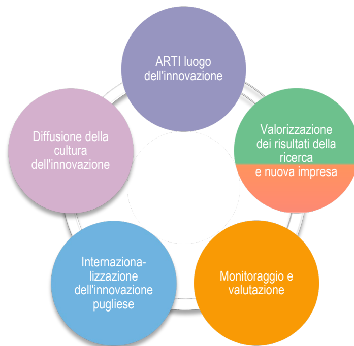
Figura 2 – Le linee di attività dell'ARTI

Di seguito si fornisce uno schema delle attività istituzionali : esse generano e sottendono progetti multidisciplinari generalmente affidati all'Agenzia dalla Regione o che l'Agenzia realizza quale partner di progetti europei.