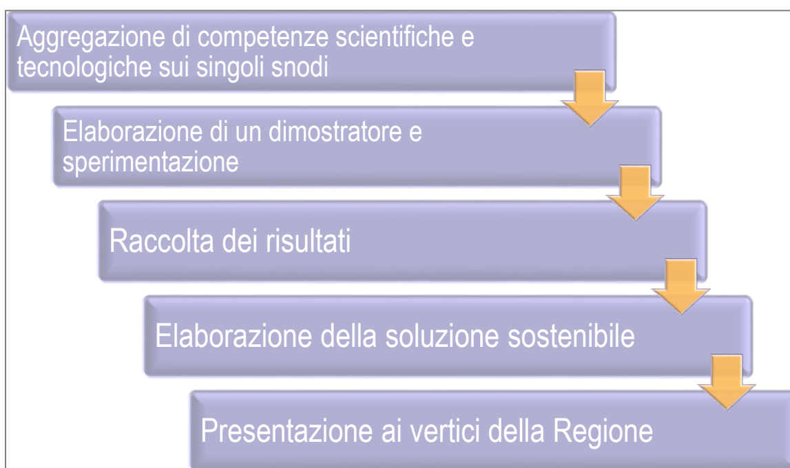
Figura 3 – Fasi della metodologia

In alcuni casi potrà trattarsi di un simulatore, in altri di un proof of concept (cioè di un prototipo in embrione), di un prototipo in scala, di un progetto dimostrativo pilota, di un laboratorio reale o virtuale, di eventi dimostrativi.