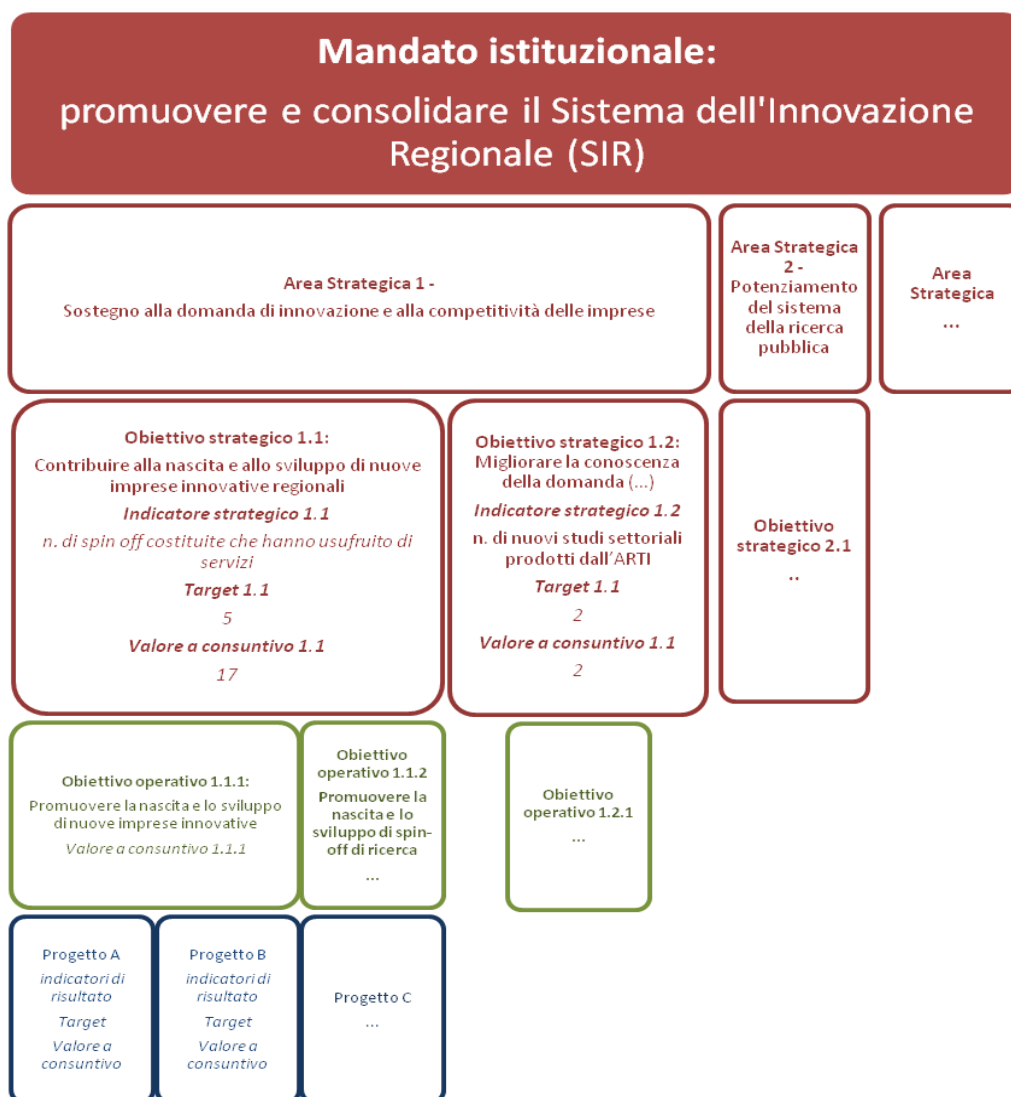
Figura 3 - L'Albero della Performance dell'ARTI

Pertanto il linea con tale Albero, nei tre allegati che costituiscono parte integrante della presente Relazione sono rendicontati i risultati conseguiti dall'ARTI nel corso del 2013. In particolare in per ciascun obiettivo strategico, operativo e progettuale sono indicati i valori a consuntivo rispetto ai target previsti. Inoltre, così come indicato nel documento ANAC "Istruzioni per la compilazione degli allegati della delibera CIVIT n 5/2012 ai fini della stesura della Relazione sulla performance 2012" (30 giugno 2013), è stata inserita un'apposita colonna nella quale è indicato il Grado di Raggiungimento dell'obiettivo.