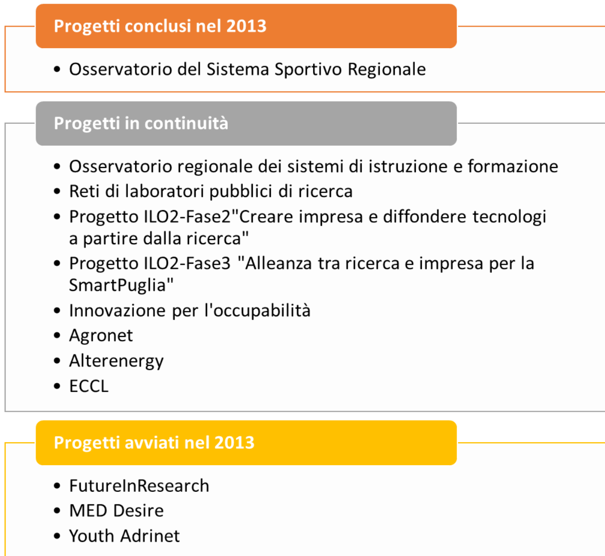
Figura 2 - Il progetti ARTI alla fine del 2013

Alla fine del 2013 l'insieme dei progetti gestiti e coordinati dall'Agenzia si presenta come indicato nella figura 2. Nella figura sono specificati i progetti conclusi, in continuità e di nuovo inizio.